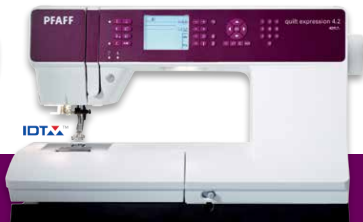
quilt expression™ 4.2